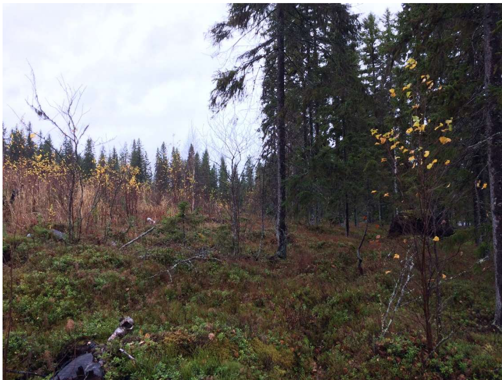
Bild 2. Brukad skog dominerar området

Området är barrskogsdominerat med inslag av lövträd, främst björk, och partier av kalhyggen förekommer. I fältskiktet förekommer främst växtarter som bärris och gräs. Området är tydligt påverkat av modernt skogsbruk.