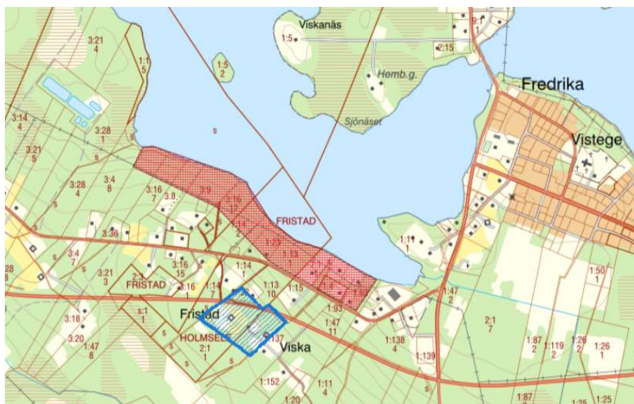
Bild 1. Röd markering visar föreslaget LIS-område. Blå markering visar vattenskyddsområde.

LIS-området Fredrika ligger vid Viskasjön väster om Fredrika tätort efter Holmselevägen, se bild 1. Området är ca 13 hektar stort. Strandlinjen har en längd på ca 1 kilometer. I området finns intresse att bygga bostäder.