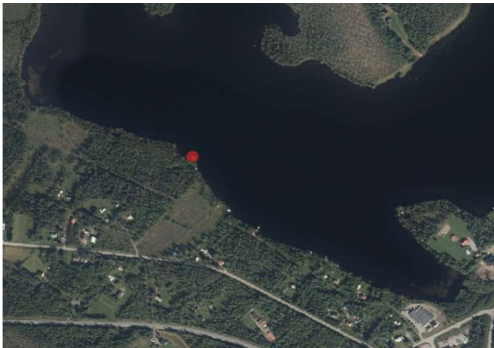
Bild 4. Röd markering visar lokalisering av grillplats.